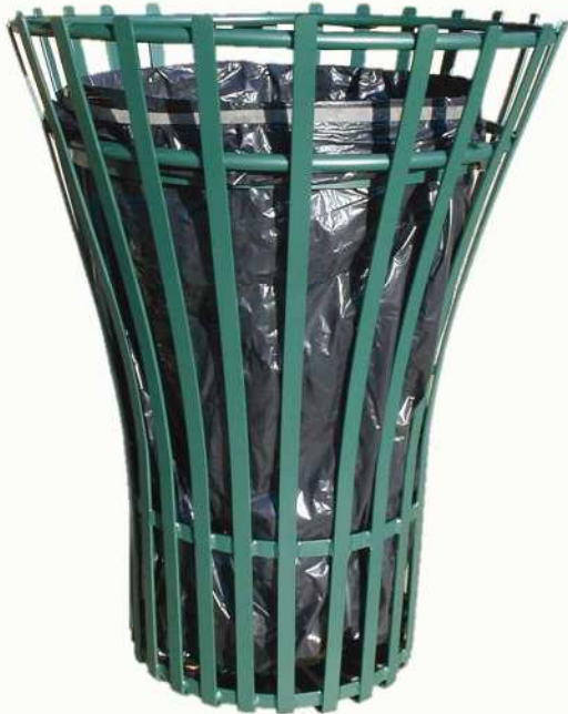
Version acier «laqué vert» : LV